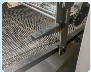
▲排水処理後、すすいで終了