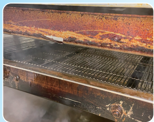
▲オートフライヤーにこびりついた油污れ

当社製品のピュアクレンは洗浄と殺菌を1工程で行うため、半分の工程で終了させることが可能です。それにより作業時間の短縮、水道光熱費節約、人件費の削減が可能です。