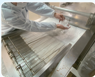
▲本製品をお湯（60℃）に投入