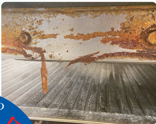
▲時間経過とともに汚れが剥がれ落ちる