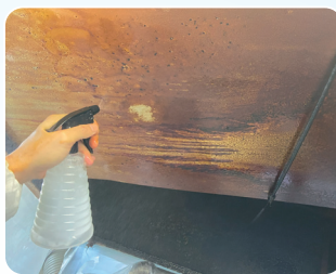
▲スプレーで直接吹きかけてもOK